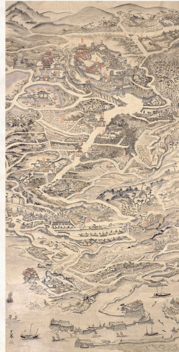
Vista de pájaro de Shuri Naha Segunda mitad del siglo XIX

En el Archivo Público Documental de Okinawa documentos históricos y otros tipos de documentos están reunidos en colecciones, ordenados, y conjuntamente se logra su conservación. Por medio del uso de estos documentos, fue inaugurado en el 1 de agosto de 1995 con el objetivo de un estímulo y contribución para el estudio y la cultura. Nos enfocamos en diferentes trabajos para resguardar archivos oficiales de propiedad pública y transmitirlos al futuro.