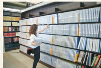
採開架式、可自由使用。