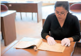
可閱覽、複印公文書等資料。