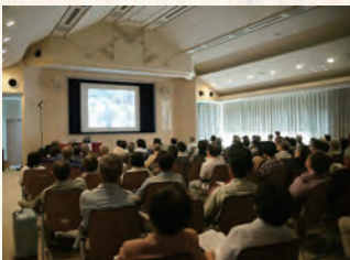
舉辦公文書管理、沖繩歷史及資料相關講座等活動。