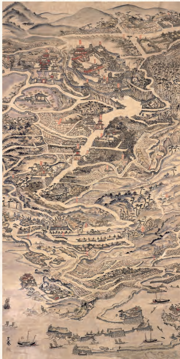
首里那霸鳥瞰圖 19世紀後半

地址 901-1105 沖繩縣島尻郡南風原町字新川 148-3 TEL : 098-888-3875 FAX : 098-888-3879