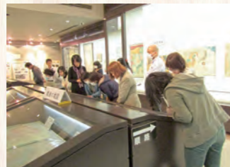
藉由各種主題陳列展示館藏資料。