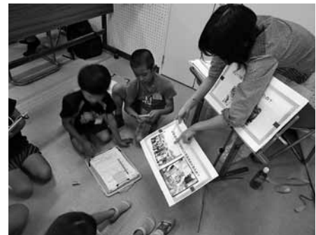
図3 「名人さんお招き会」の様子