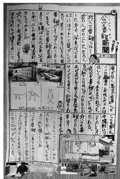
図1 夏休みに作成した新聞 当館のリーフレットなどの刊行物から写真などを切り抜き、館内見学の際にあげた和紙が貼られている。

夏休み前に児童の担当テーマを決定するには宿題として課す以外にも理由がある。それは、保護者面談の際に、児童それぞれの担当テーマを保護者にも伝え、夏休み中の協力を仰ぐためである。実際、夏休み期間中に各自の調査に父母や祖父母らと来館してくれる。調査方法は展示室を見てガイドブックをもらって帰る子、閲覧室にも入室し実際に写真などを調べてみる子、館内見学を希望する子などさまざまであった。館内見学の要望があった場合は、書庫や修復室などバックヤードも案内した。この夏休みの調査では保護者ととともに当館について調べることから、児童のみならず保護者、特に利用の少ない20～30代への普及広報にもつながっている。