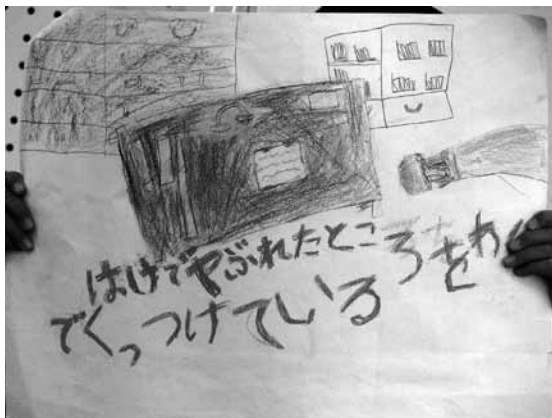
「はけでやぶれたところをわしでくっつけている」