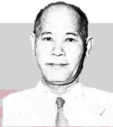
初代行政主席 比嘉秀平 1952.4.1 - 1956.10.25