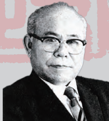
第5代行政主席 屋良朝苗 1968.12.1 - 1972.5.14