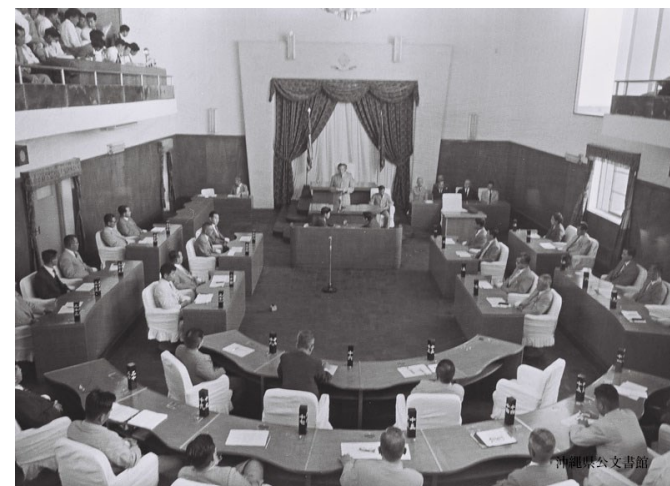
ムーア高等弁務官メッセージ 立法院第12回議会 定例会

『琉球政府関係写真資料 152』 【資料コード:0000108862 写真番号:042466】