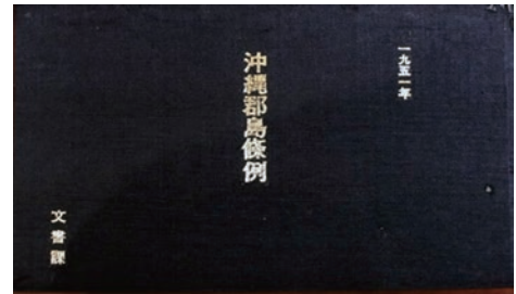
「沖縄群島条例 沖縄群島知事署名原議書 1951年」 資料コード 0000068230

県が法律の範囲内で制定する条例（琉球政府においては立法）、規則その他重要な規程等の制定や改廃に関する文書。県条例の制定や改廃は、県議会の議決を経て知事が公布し施行されます。