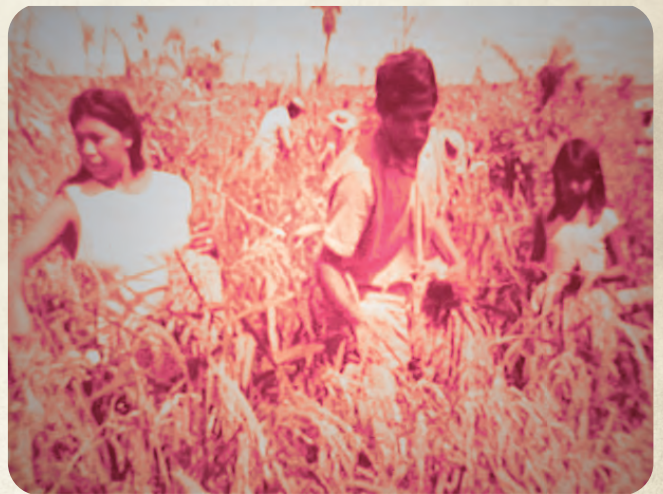
▶ 午後4時10分～ 「ポリビアに拓く緑のコロニアー15年目の沖縄移住地」 1970年 企画/海外移住事業団 有声/カラー 37分