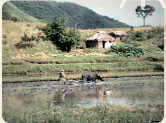
▶ 午後2時15分～ 「開拓の地 八重山」 1950年代後半 制作/米国民政府 無声/カラー 16分