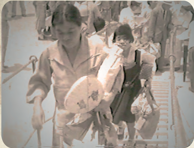
▶ 午後2時～ 「琉球ニュース（南米ポリヴィアへ移民団出発）」 1954年 制作/米国民政府 有声/モノクロ 15分