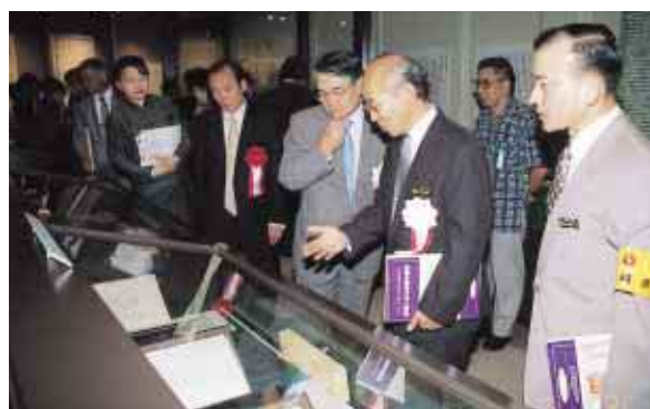
展示会場（公文書館）