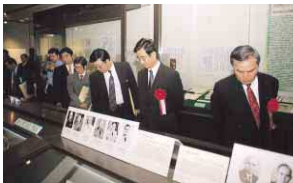
展示会場（公文書館）