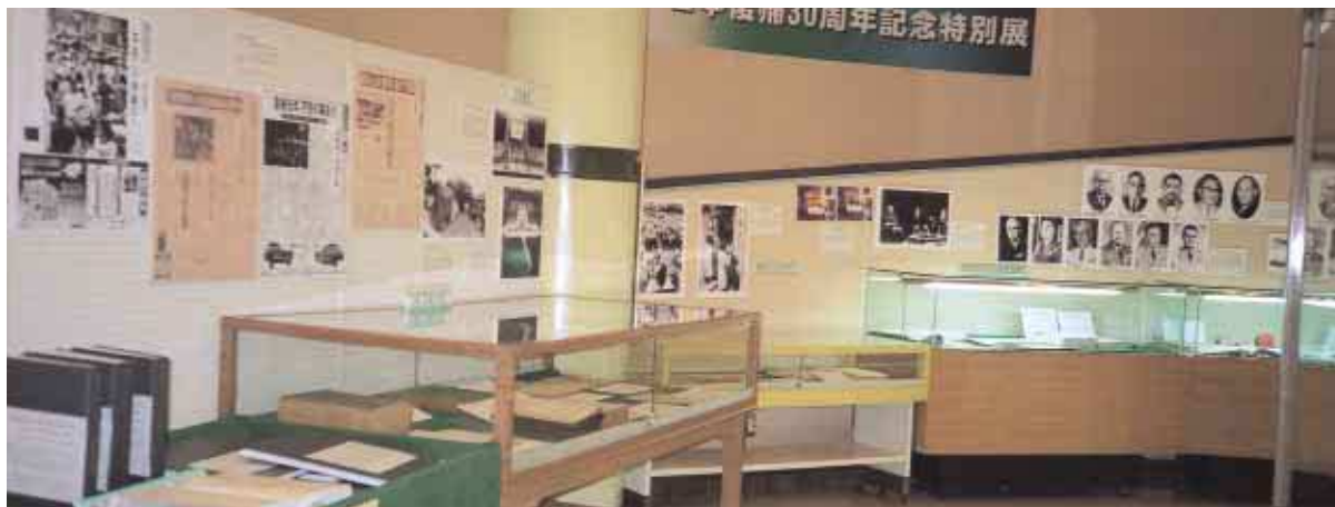
宮古移動展（平良市総合博物館）