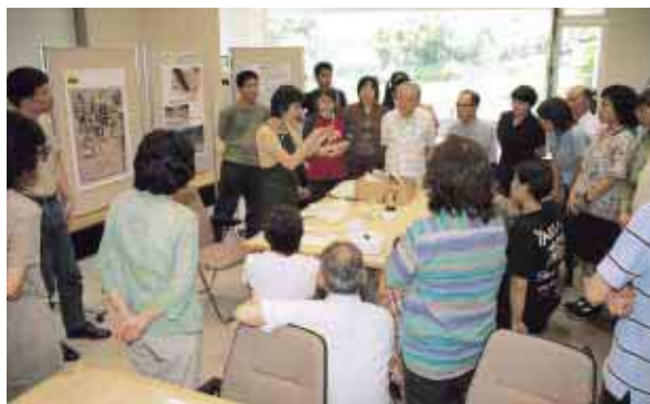
修復の説明「紙の目とは…」