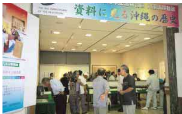
八重山移動展（石垣市立図書館）