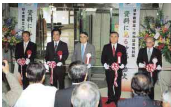
開会式テープカット