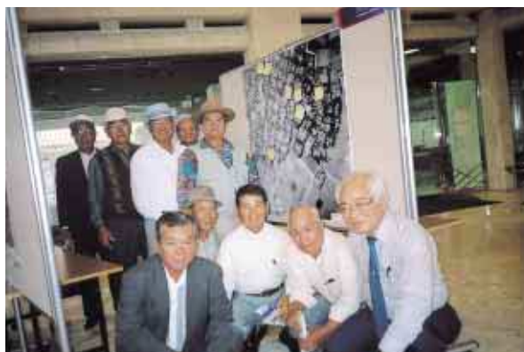
読谷村字波平の皆さん