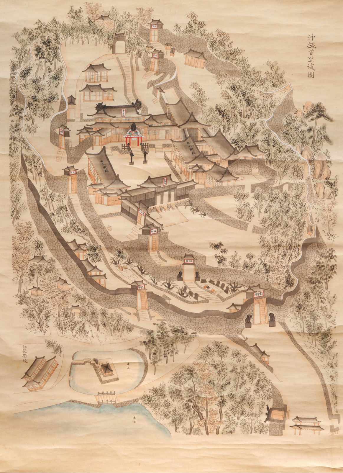
沖縄首里城図 年代、作者ともに不明。1886年(明治19)1月に龍潭のほとりに新築移転した沖縄県立師範学校が描かれている。114×67cm[T00016943B]

琉球王国から琉球藩、そして一八七九年の沖縄県設置へー 薩摩の侵攻から沖縄戦直前までの琉球・沖縄の足どりを、沖縄県公文書館所蔵資料で概観します。