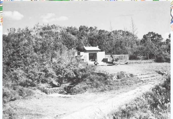
⑤弁ヶ岳。樹木は低く、ススキなどもみられます（1960年1月） （写真番号：045124）

弁ヶ岳付近について現在の地図（国土地理院）に示しました。モノレールの石嶺駅や首里駅と弁ヶ岳をみると位置関係がわかりやすくなると思います。表紙の写真は大きな赤矢印の方向から撮影したと思われる。前頁の①②の写真は弁ヶ岳の上空から、③の写真は小さい青矢印方向、④は緑矢印方向、⑤は紫矢印から撮影したと思われる。