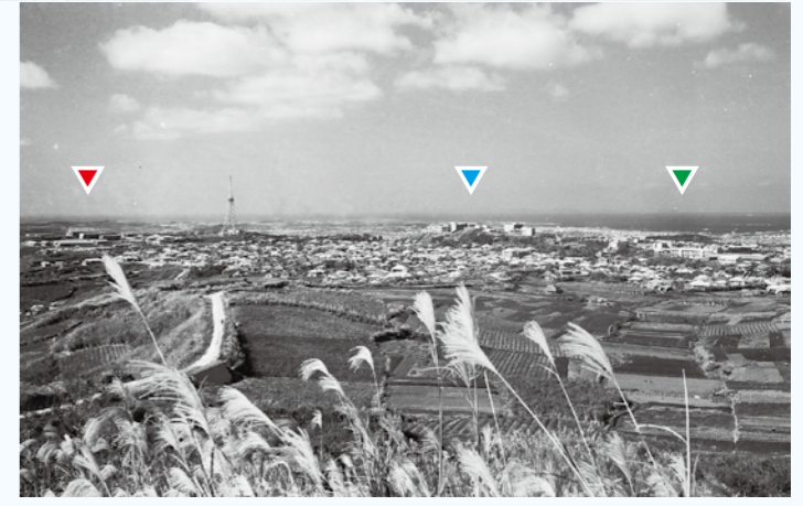
① 1945年1月3日の弁ヶ岳。鉄塔の影（▲）が少なくとも5本確認できます（資料コード：KS00000053【ON12835 031-2】）