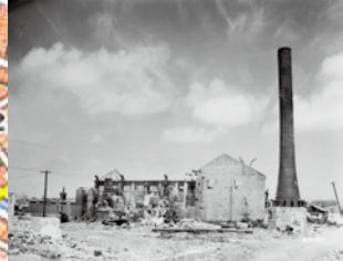
②武徳殿（1945年5月、図中▼）（写真番号：74-29-2）