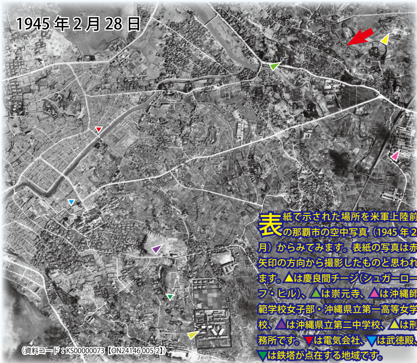
表 紙で示された場所を米軍上陸前の那覇市の空中写真(1945年2月)からみてみます。表紙の写真は赤矢印の方向から撮影したものとされます。▲は慶良間チーズ(シュガーローフ・ヒル)、▲は崇元寺、▲は沖縄師範学校女子部・沖縄県立第一高等女学校、▲は沖縄県立第三中学校、▲は刑務所です。▼は電気会社、▼は武徳殿、▼は鉄塔が点在する地域です。