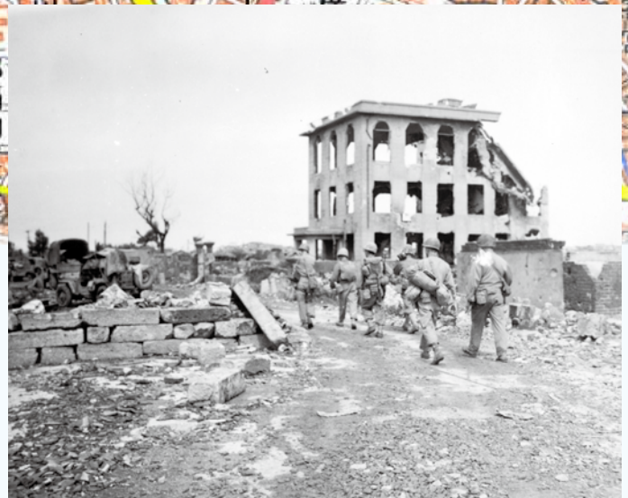
写真③ ▼付近にあった開洋会館の建物。(1945年5月29日) (写真番号：72-33-3)

前頁の矢印の位置を現在の地図（国土地理院）に落としてみました。地図上の矢印や三角印は空中写真とほぼ同じ位置になります。写真③は地図上の那覇中学校の近く、▼付近にあった開洋会館です。