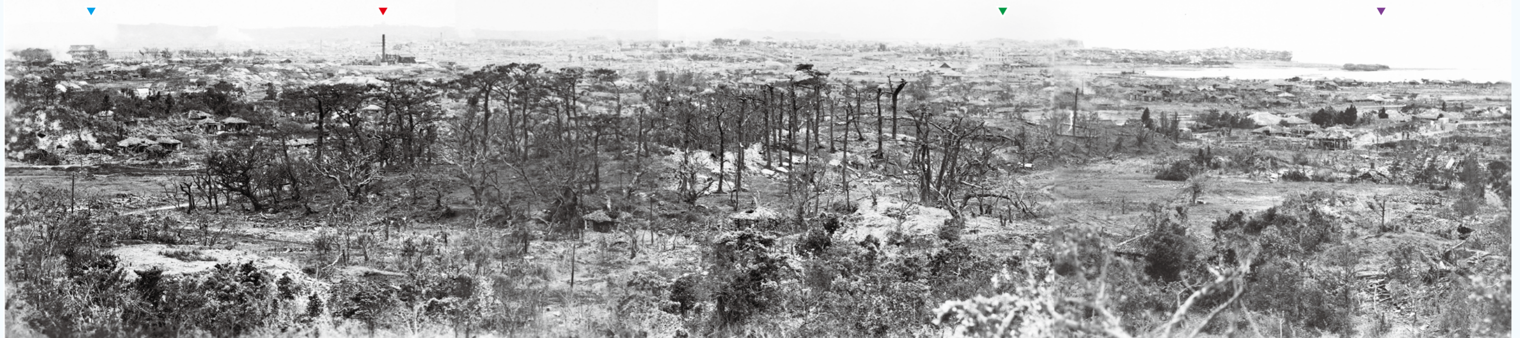
写真① この写真は4枚の写真をつなぎ合わせたものです。遠景をみると▼武徳殿、▼電気会社、▼開洋会館、▼ミートウジー（夫婦岩／夫婦瀨）が確認されます。中央の松林の丘は崇元寺の裏側になっているようです。写真左側は、本リーフレットNo.12のパノラマ写真と連続しています。（1945年6月）（写真番号：92-03-1,91-36-2,91-12-2,91-34-3を接合）[91-12-2,91-34-3は日付が明記されていませんが他と同じ6月として扱いました]

写真② 泊付近を俯瞰した斜め写真で、地形のようすがわかります。安里三叉路から首里に抜ける道路が軽便鉄道軌道の下を通っているのがみえます。米軍上陸後ですが、まだ泊付近には侵攻していないようで、古い風景が残っています。それぞれの三角の地点は、左頁と同じです。▲は安里国民学校で、現在の沖縄県立博物館・美術館付近になります。表紙を含め、写真①は赤矢印付近から撮影したと考えられます。（1945年4月2日）（資料コード：0000256131）