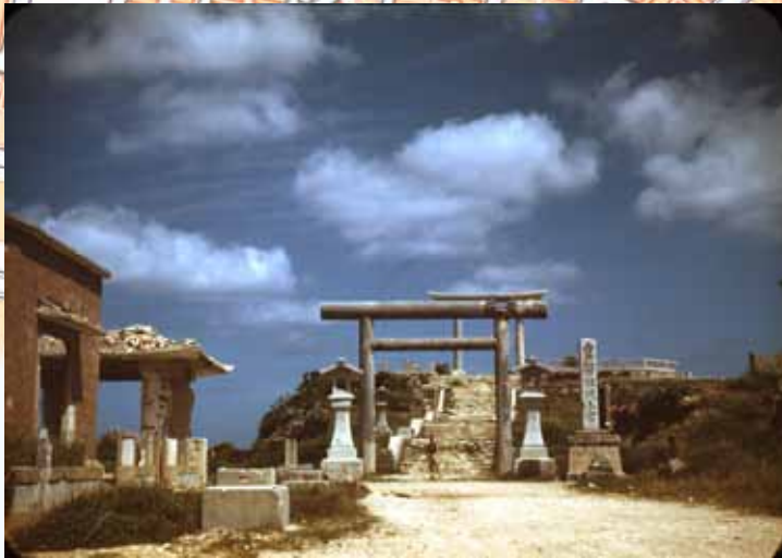
写真⑧ 波上宮。(1950年頃) (資料コード: 0000086412 【1121】)

前頁の矢印の位置を現在の標準地図（国土地理院）に落としてみました。地図上の矢印や三角印は空中写真とほぼ同じ位置になります。写真⑧は1950年頃の波上宮です。人影がほとんどなく、まだ沖縄戦の傷跡を残しているようです。