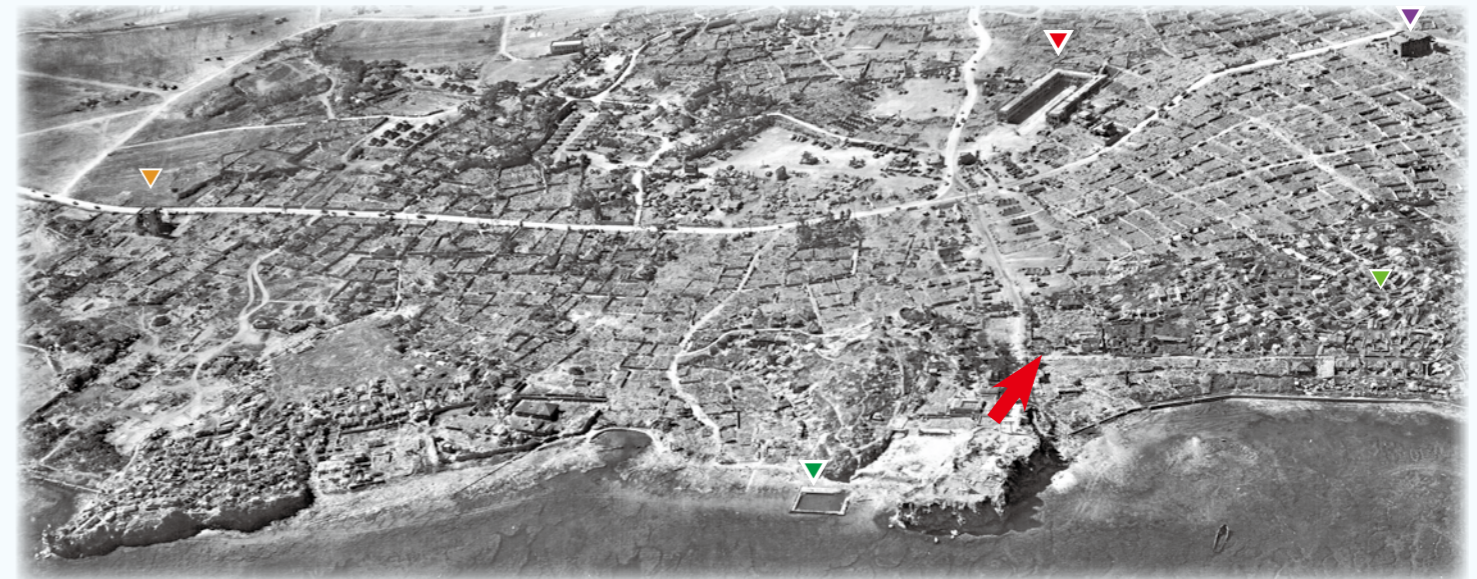
写真③ 波上宮からの撮影方向を矢印で示します。▼は那覇市営波上プール、▼上之山国民学校、▼開洋会館*(本リーフレット No.18 参照)、▼辻原墓地、▼新天地劇場になります。(1945年7月1日)(資料コード:0000256318)

表 紙で示された場所を米軍上陸前の波上宮付近の空中写真(1945年2月)からみてみます。表紙の写真は赤矢印の方向から撮影したと思われます。▼は那覇市営波上プール、▼上之山国民学校(現在の上山中学校)、▼は辻原墓地付近になります。