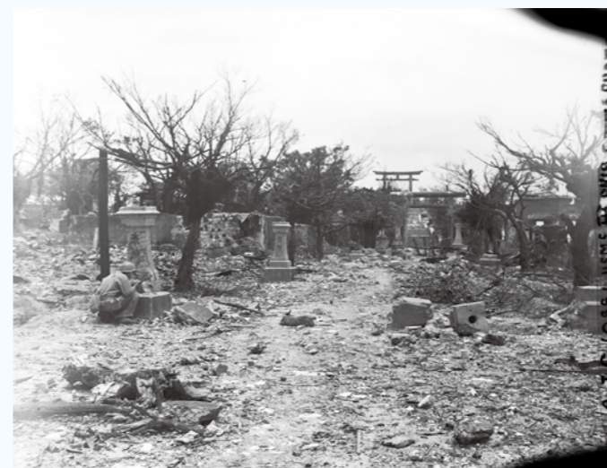
写真⑥ 沖縄戦最中の参道。(1945年5月29日)(写真番号:72-36-1)