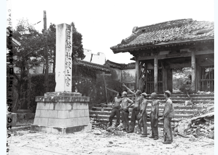
写真⑦ 「官幣社波上宮」の石碑と護国寺。(1945年か)(写真番号:74-22-1)