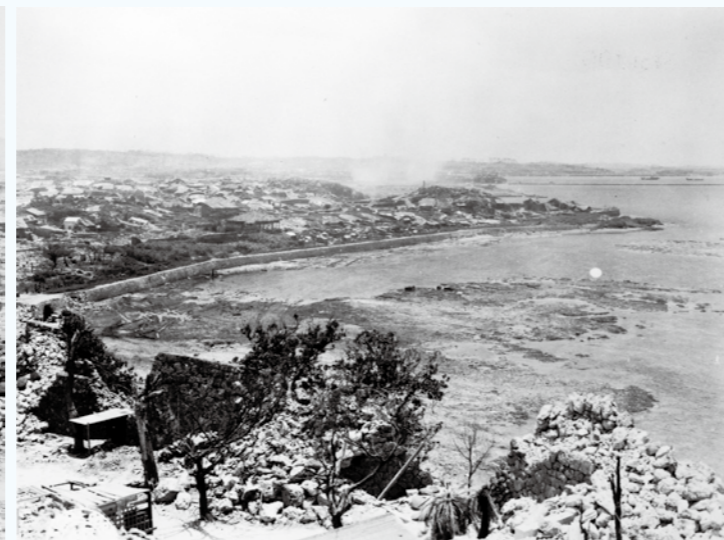
写真② 写真①と同じ位置から撮影か。遠方に辻原墓地*がみえ、その後方には煙がみえます。(1945年6月~7月)(写真番号:06-66-2)