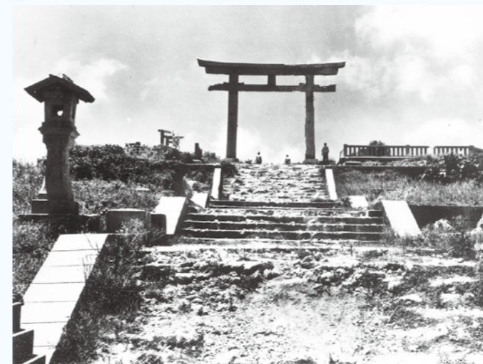
写真④ 第二鳥居。戦後2年目ですが、草が生え、階段は利用できそうにもありません。(1948年)(写真番号:14-10-3)