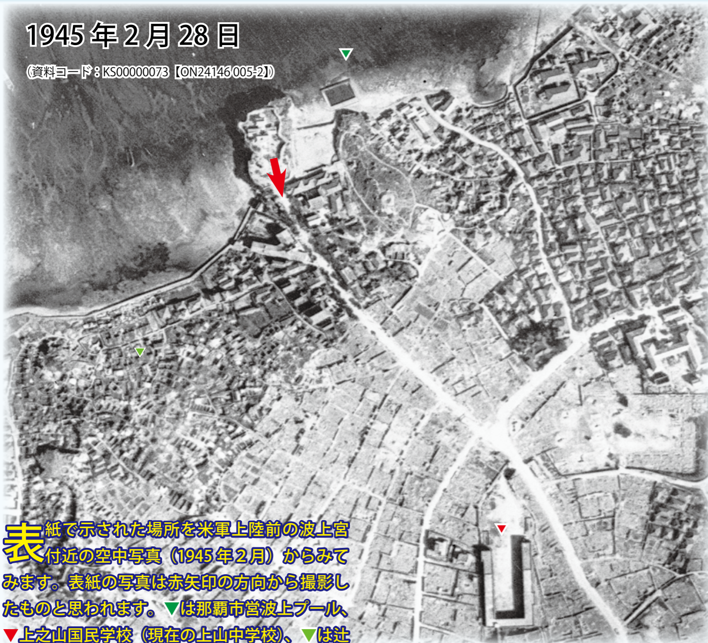
表 紙で示された場所を米軍上陸前の波上宮付近の空中写真(1945年2月)からみてみます。表紙の写真は赤矢印の方向から撮影したと思われます。▼は那覇市営波上プール、▼上之山国民学校(現在の上山中学校)、▼は辻原墓地付近になります。