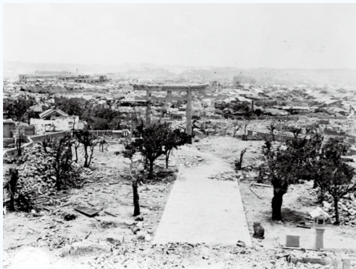
写真① 表紙と同じ写真。写真②と連続撮影しているようです。(1945年6月~7月)(写真番号:06-66-1)