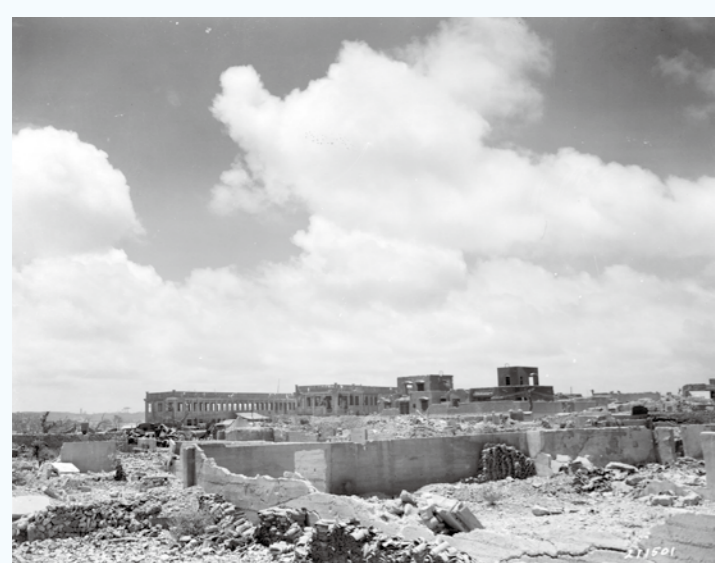
写真① 勸銀社宅と上之山国民学校がみえます。辻付近から撮影しているようです。（1945年）（写真番号：02-46-1）