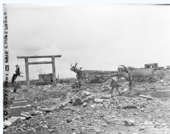
写真④ 交番近くの鳥居。その背後に建物、上之山国民学校と勸銀社宅がみえます。（1945年5月29日）（写真番号：74-11-4）