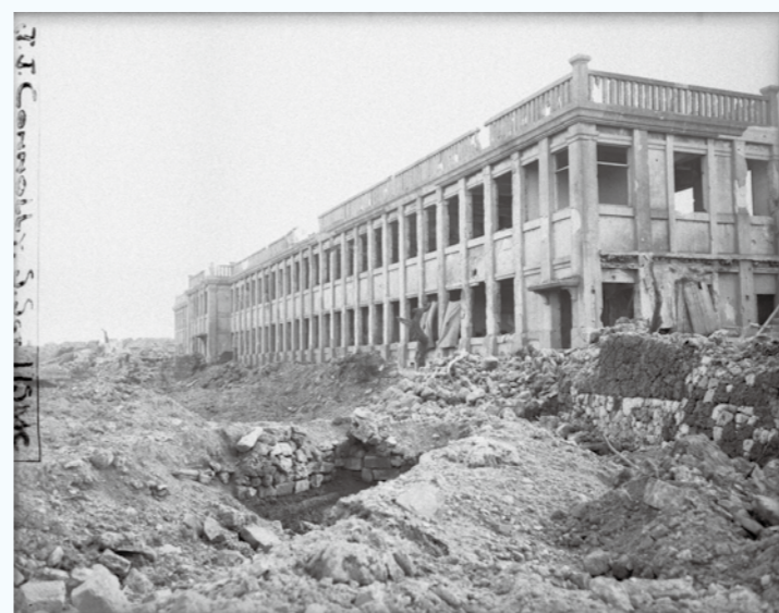
写真⑥ 上之山国民学校の東側になります。（1945年5月）（写真番号：74-31-2）