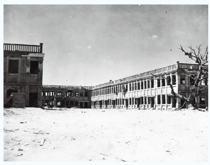
写真⑦ 上之山国民学校。戦後、校舎は政府庁舎として一時期使われました。（1946年7月3日）（写真番号：14-12-1）