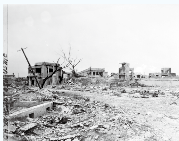
写真⑤ 鳥居の背後にあった建物で本の看板がみえます。国民学校や社宅がみえます。（1945年5月）（写真番号：74-32-3）