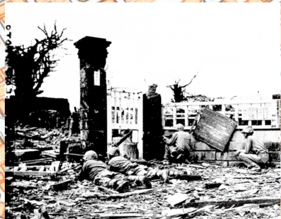
写真⑧ ▼は那覇地方裁判所。拡大すると裁判所の文字がみえます。(1945年5月29日) (写真番号：88-14-3)

前頁の矢印の位置を現在の標準地図(国土地理院)に落としてみました。地図上の矢印や三角印は空中写真とほぼ同じ位置になります。写真⑧は▼にあった裁判所。戦後、跡地は郵政の中心になりました(写真⑨)。