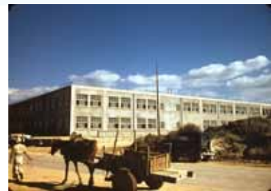
写真⑨ 戦後、▼那覇地方裁判所の跡に郵便局ができました。写真を拡大すると「郵政局/那覇中央郵便局/那覇中央電信局」の看板がみえます。(1950年頃) (資料コード:0000086415【2120】, 0000086414【2009】)