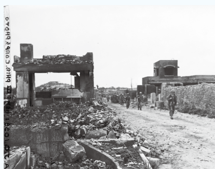
写真② 勸銀社宅を東側から撮影しているようです。（1945年5月29日）（写真番号：88-33-4）